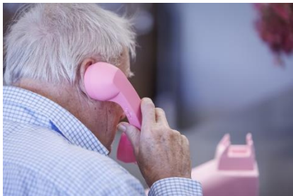
Amical a intégré une intelligence artificielle à un téléphone pour créer un compagnon pour les personnes atteintes d'Alzheimer afin de briser leur solitude.